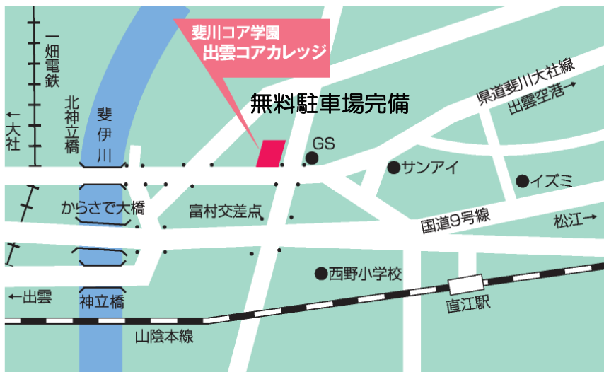
JR直江駅から徒歩約10分